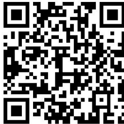
2.政府投资项目建议书审批