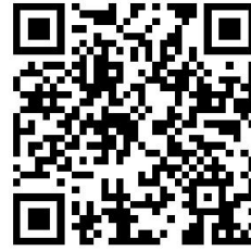
违规禁办事项清单